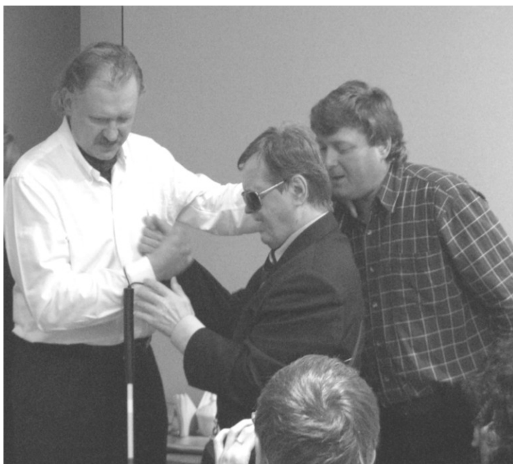
Благодарность за часы

Все эти мероприятия, организуемые на европейском уровне, направлены всецело на развитие социальной активности людей со слепоглухотой, их включенность в жизнь общества и привлечение к решению собственных проблем во взаимодействии с общественными и государственными организациями. Сейчас настало самое время включения слепоглухих в общественное движение (как на национальном, так и на международном уровне) за признание законности их прав и равенства со «здоровой» частью общественности, за развитие системы