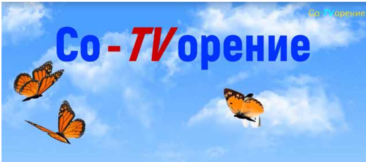
Заставка одного из видеофильмов проекта «Со-TVорение»

за помощью, чтобы подчистить, подредактировать звук: из-за проблем со слухом у меня нет опыта именно такой работы. Что-то делаю, убираю лишние шумы, как могу и слышу, но это не всегда удается: всё равно какие-то искажения остаются. А всё остальное — увеличить или уменьшить громкость, вырезать где-то кусок, музыку подобрать и прочее — делаю без проблем. Сложность также в том, что окно редактора текста для вставки субтитров — маленькое (соответственно, буквы — мелкие). Приходится работать с лупой как в ручном, так и в электронном формате, что отнимает много времени.